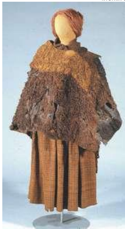
Huldrekvinden bar klædet over højre skulder, det var lukket med en nål under venstre arm.